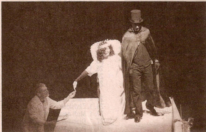
STRACH do dětských očí přinášeli Ledová královna a Pán temnot, kteří neváhali využít služeb doktora Frankensteinova.

Vypadá to, že alespoň v letošní sezoně se ve Slezském divadle budou pohádky zachraňovat úspěšně. Minimálně o tom svědčí závěrečný potlesk nejen dětského obecnstva. Autorka hry může zároveň doufat, že se k dospělým donese skrze divadelní prkna i poselství, že děti potřebují svět fantazie a jejich přítomnost, nikoliv jen televizi.